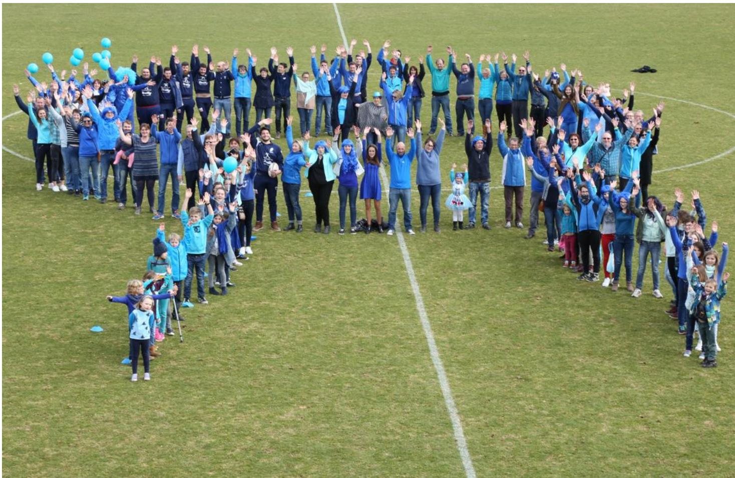
Le nœud géant humain a été réalisé hier dimanche 12 mars par une bonne centaine de personnes. Pour certains, des habitués de la manifestation. Pour d'autres, c'était une première.

Mars, c'est en bleu que ça se passe. À Pontarlier peut-être encore plus qu'ailleurs, puisque c'est ici que l'association « Sourire et Santé » ne ménage pas sa peine pour informer et sensibiliser sur le dépis-